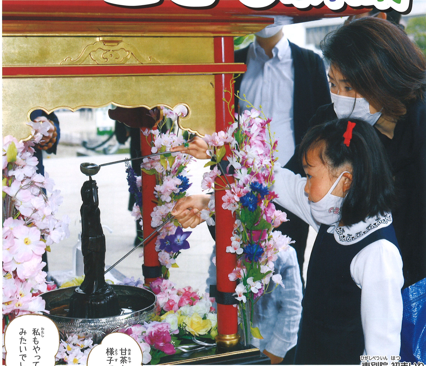
ひがしべついん はつ 東別院 初まいり