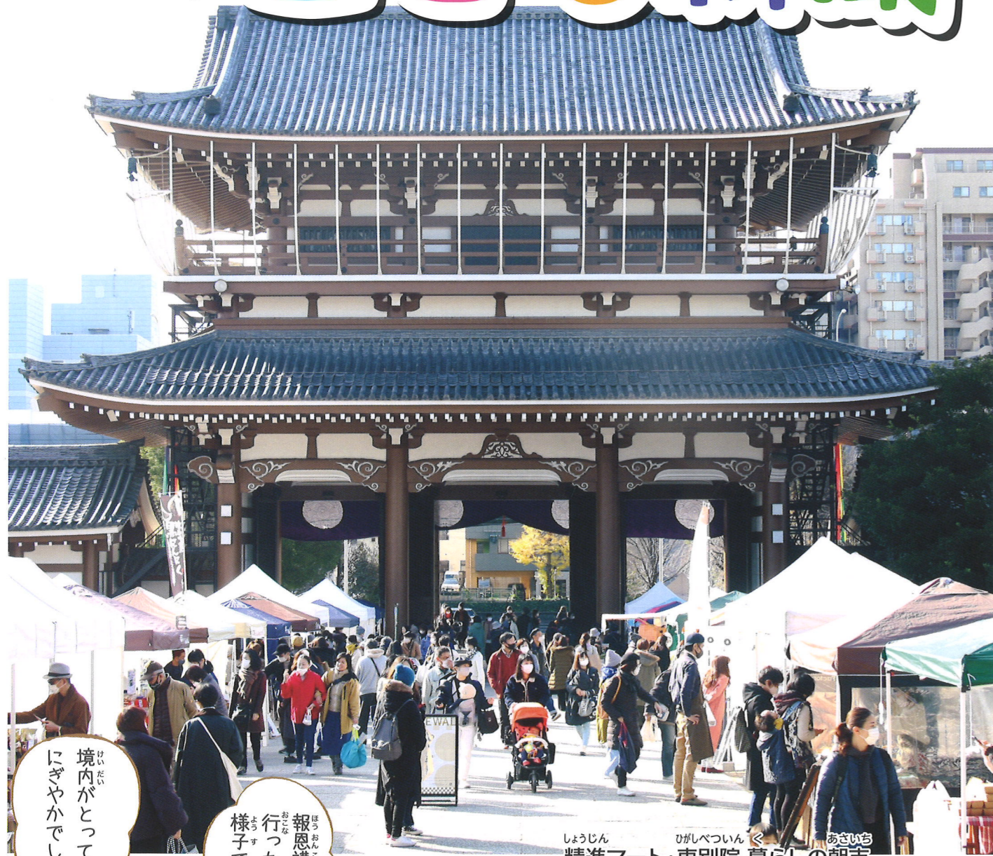
しょうじん ひがしべついん く あさいち 精進マート・東別院 暮らしの朝市