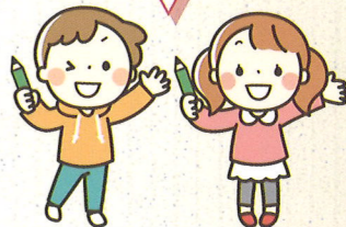
「こども新聞取材班」