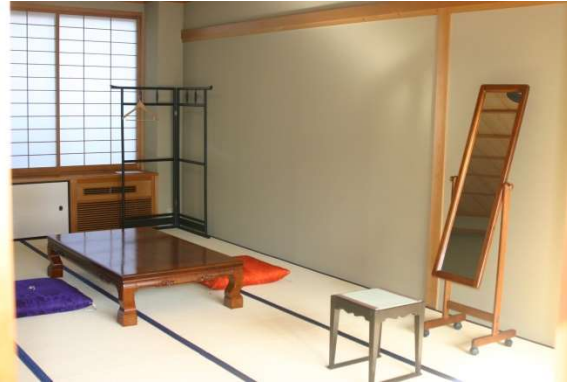
- ご親族控室 -