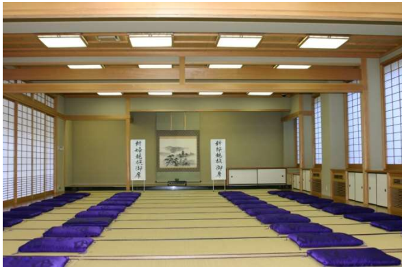
- 対面所 -